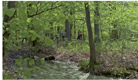
Friedwald, Bad Münstereifel