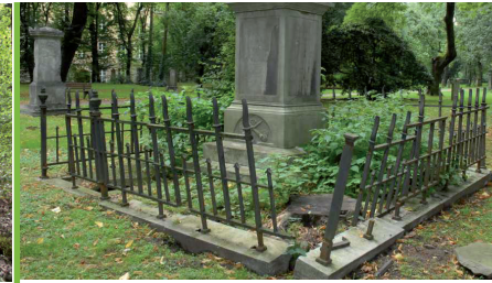
Histor. Grabstätte, Nordfriedhof Düsseldorf