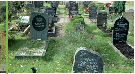
Muslimischer Friedhofsbereich, Essen

11.30 Uhr „Das kulturelle Erbe bewahren: Denkmalpflege auf Friedhöfen“