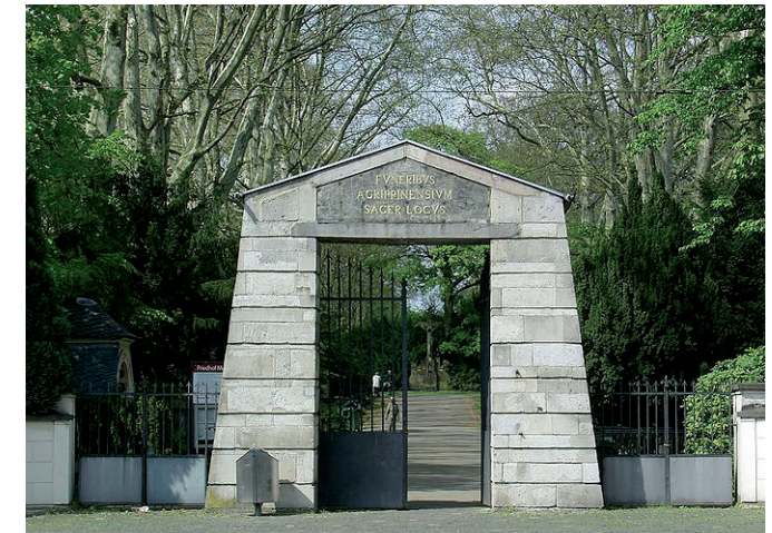
Melatenfriedhof Köln, Haupteingang Aachener Straße

2.) moderne Grabformen / heutige Gestal- tungsvarianten / Bewirtschaftung